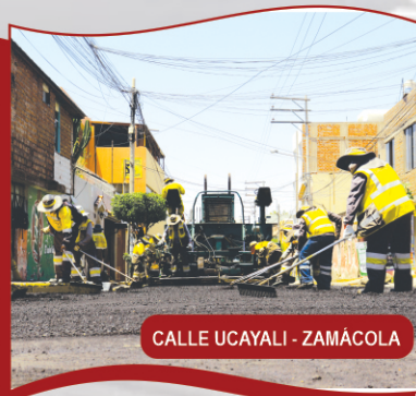
CALLE UCAYALI - ZAMÁCOLA