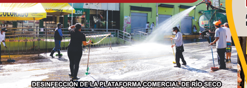
DESINFECCIÓN DE LA PLATAFORMA COMERCIAL DE RÍO SECO