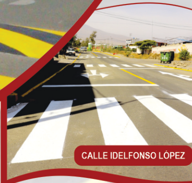
CALLE IDELFONSO LÓPEZ